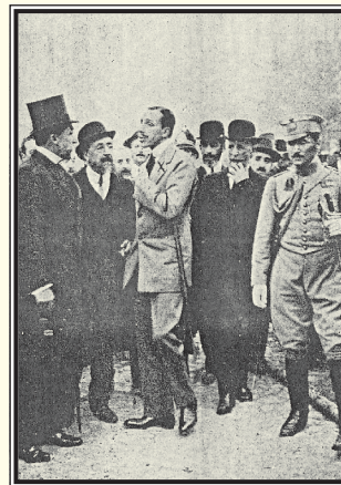
A la izquierda, curiosa instantánea de soldados y barrenderos poniendo a salvo los muebles. En la otra imagen S.M. el Rey Alfonso XIII visitando el lugar del siniestro.